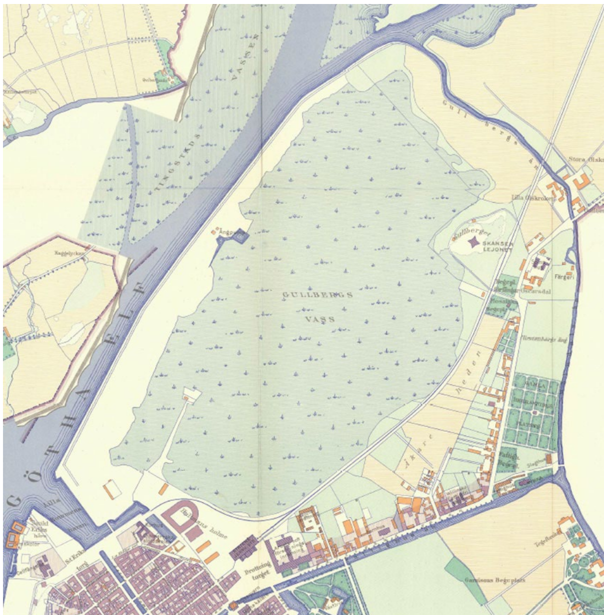
Gullbergsvass 1860.

Våren 1859 var invallningen av området klar från Lilla Bommen till Gullbergsvassbron. På vällen fanns en anläggning med en ångpump som med hjälp av en högtrycksmaskin byggd hos Keiller & Co började att tömma vassområdet på vatten den 17 maj 1859. Samtidigt inleddes arbetet med att fylla ut området innanför vällen, men det skulle komma att ta en del tid och det fanns en oro inför sommaren över stanken som skulle bildas i det nyligen torrlagda området, men "ett obehag som man väl får tåligt fördraga för den goda saken skull" som Göteborgs Posten uttryckte saken.[8] Sommarvädret visade sig bli varmt och torrt vilket snabbt torkade leran och gav upphov till en riklig vegetation i området vilket tillsammans gjorde att den befarade stanken nästan helt uteblev.[9] Vid årsslutet kunde Kom:e för Gullbergsvassens uttorkning lämna rapport till staden. Kostanden för invallning och utpumpning av vattnet hade varit 64 795 riksdaler och 56 öre, därmed hade det skett en kostnadsökning med 3 926 riksdaler jämfört med det kostnadsförslag som upprättats innan arbetet inleddes. Av kostnaden hade fattigvården endast kunnat bidra med 52 45 riksdaler och därmed fanns en brist i projektet på 12 345 riksdaler och 56 öre, bristen fick stadens skattebetalare stå för. När den finansiella delen var rapporterad inför