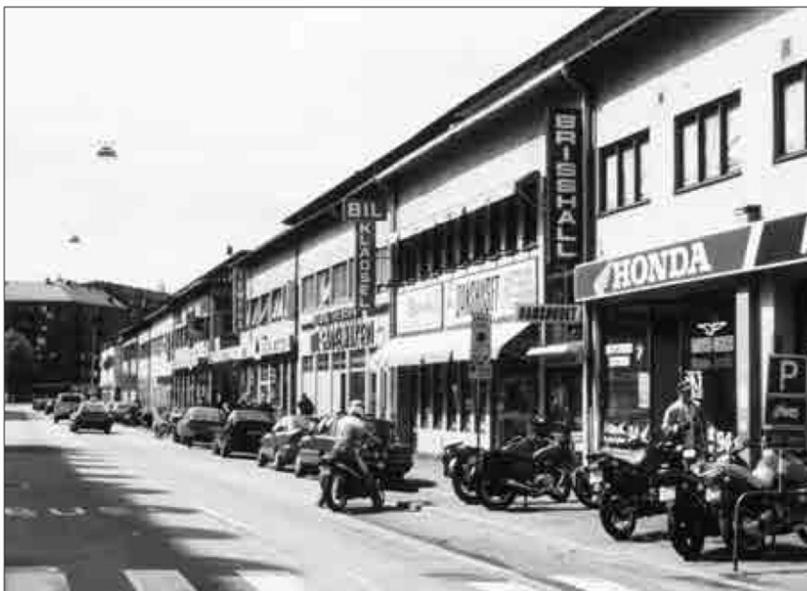
Friggagatan, vy mot Odinsplatsen.

Friggagatan under slutet av 1990-talet.