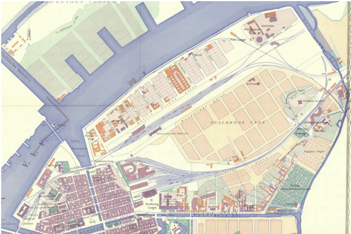
Gullbergsvass 1890.

Större delen av planen kom aldrig att bli verklighet. Allt större delar av Gullbergsvass kom istället att behövas för infrastrukturen i form av järnvägar. Stambanan hade varit under byggande sedan 1850-talet men det var först 1862 som det gick att färdas med tåg hela vägen mellan Göteborg och Stockholm. Spåren och stationsbyggnaderna låg i kanten av Gullbergsvassområdet. När Bergslagernas Järnvägar drogs fram gick dess spår och anläggningar in över det område som hade planerats som bland annat bostadsområden. Det är inte märkligt att bostadskvarter fick stå tillbaka för denna järnvägssatsning som innebar en starkt ökande export över Göteborgs hamn då bruk i Bergslagen som tidigare skeppat ut sina varor via Stockholm istället valde Göteborg. [14] Den tredje järnvägen som drogs fram över området var Västergötland–Göteborgs Järnvägar som var färdigställd år 1900 och som fick sin station vid Lilla Bommen. Slutligen fördes även Bohusbanan fram till Gullbergsvassområdet. Banan var färdig i sin helhet 1909 och var den sista av järnvägssträckorna som korsade Gullbergsvass. [15]