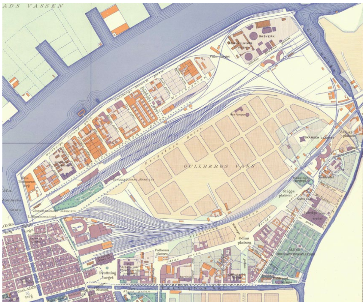
Gullbergsvass 1021.