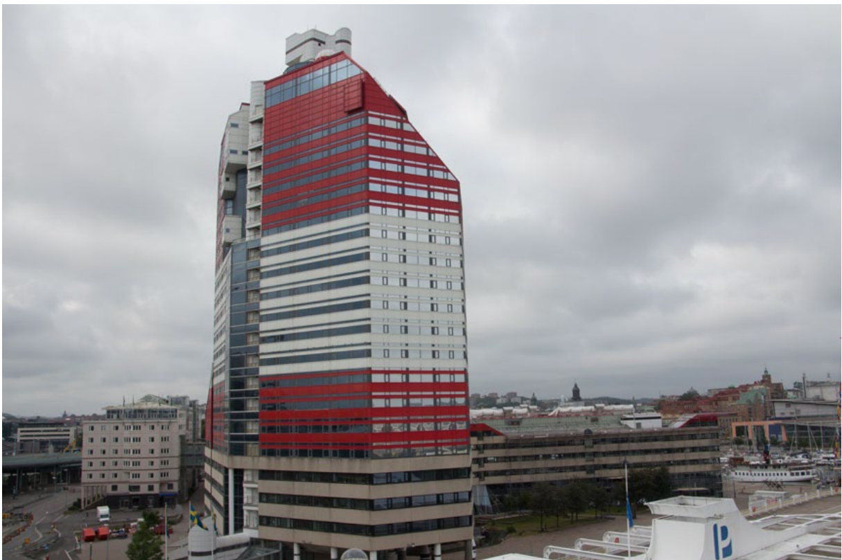
Även Lilla Bommen ligger inom stadsdelen Gullbergsvass. Foto: Per Hallén 2019.