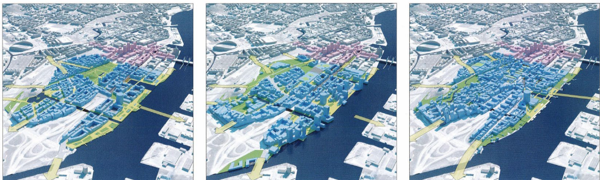
Ur: Gullbergsvass 2015.

År 2015 presenterades en förstudie över hur Gullbergsvass skall förändras i framtiden. Dokumentet innehåller de i vår tid vanliga fraserna om att ”knyta samman staden” att ”stärka kärnan” och att ”möta vattnet”, samt att ”det ska vara lätt att leva hållbart”.[21] Bakom orden finns givetvis den ekonomiska verkligheten och även den behandlas i förstudien. Utgifterna för exploateringen sägs bli 8,7 miljarder kronor vilket kräver en utbyggnad av bebyggelse med i genomsnitt cirka åtta våningar. I området beräknas 22 000 personer bo och det kan bli cirka 24 000 arbetsplatser.[22]