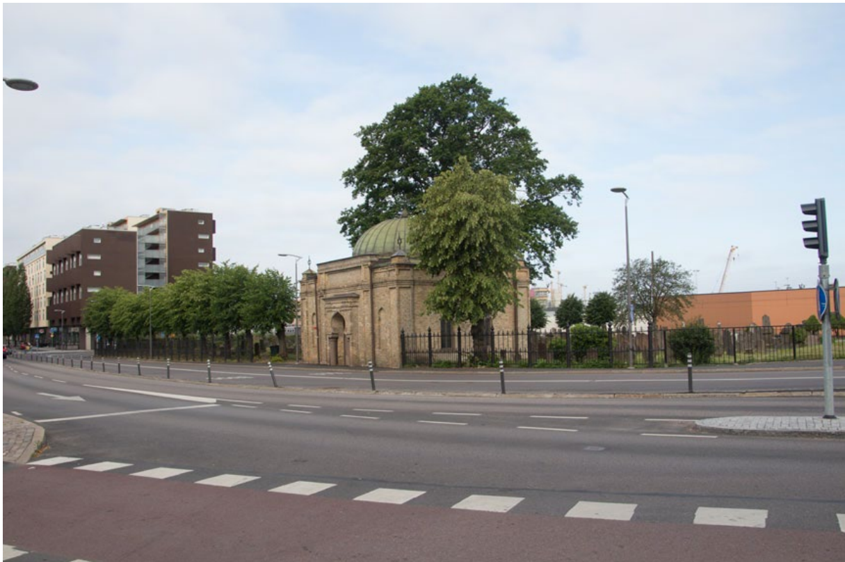
Den judiska begravningsplatsen är en av de historiska miljöerna inom Gullbergsvass. Foto: Per Hallén 2019.

År 2015 presenterades en förstudie över hur Gullbergsvass skall förändras i framtiden. Dokumentet innehåller de i vår tid vanliga fraserna om att ”knyta samman staden” att ”stärka kärnan” och att ”möta vattnet”, samt att ”det ska vara lätt att leva hållbart”.[21] Bakom orden finns givetvis den ekonomiska verkligheten och även den behandlas i förstudien. Utgifterna för exploateringen sägs bli 8,7 miljarder kronor vilket kräver en utbyggnad av bebyggelse med i genomsnitt cirka åtta våningar. I området beräknas 22 000 personer bo och det kan bli cirka 24 000 arbetsplatser.[22]