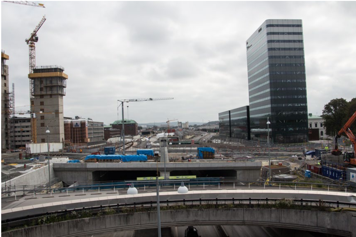
Det pågående arbetet med att täcka över Götaleden.

Men bostäder lär dröja. Länsstyrelsen påtalade 2018 att det planerade bostadsområdet ovanpå E45 (Götaleden) skulle drabbas av dålig luft och någon lösning på detta problem har inte hittats. Utsläppen invid tunnelmynningen sägs bli långt över miljökravsnormen. Den dåliga luften i området kan göra det omöjligt att bygga bostäder ovanpå tunneln samt i området mellan Nordstan och älven.[24]