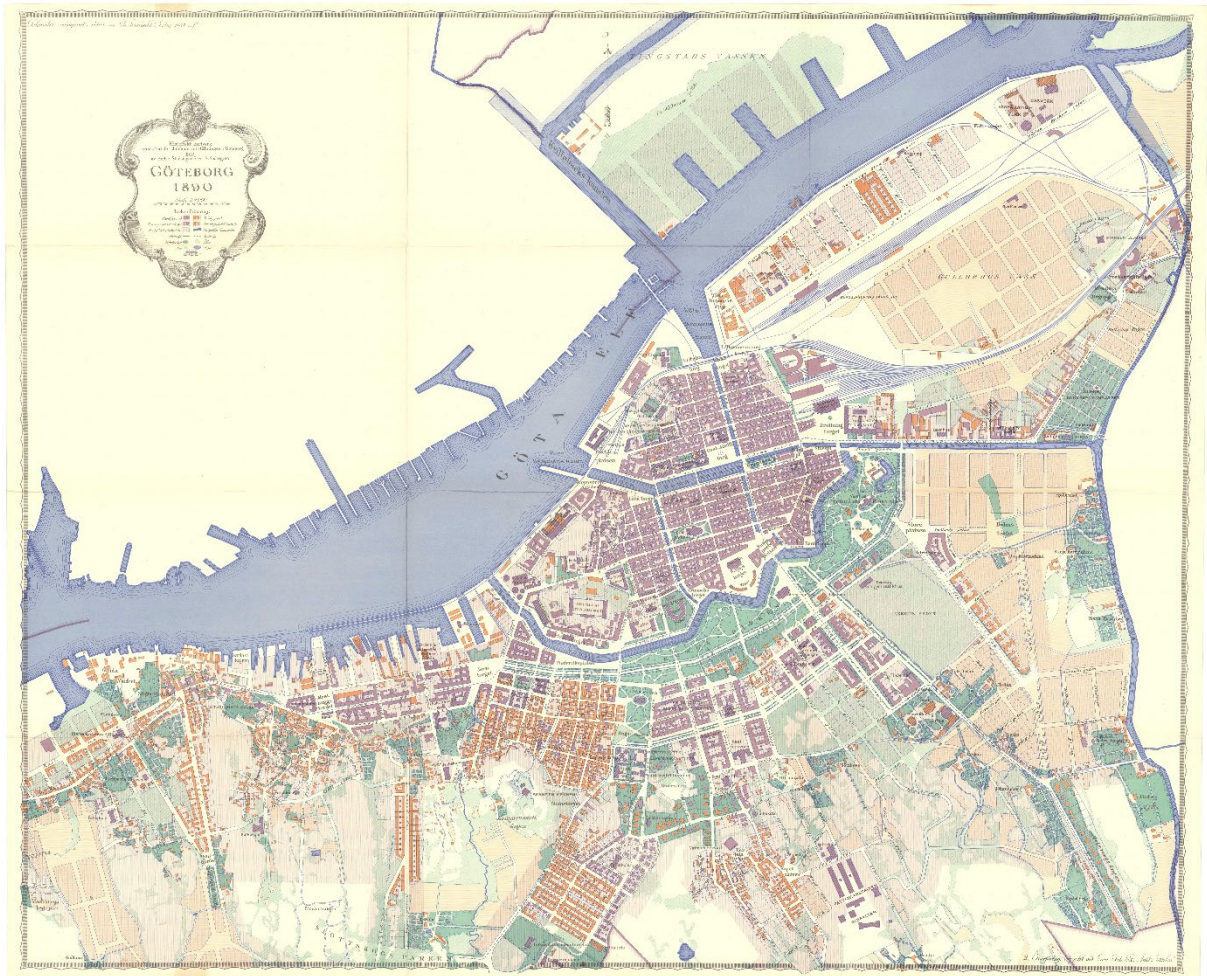
Göteborg år 1890.