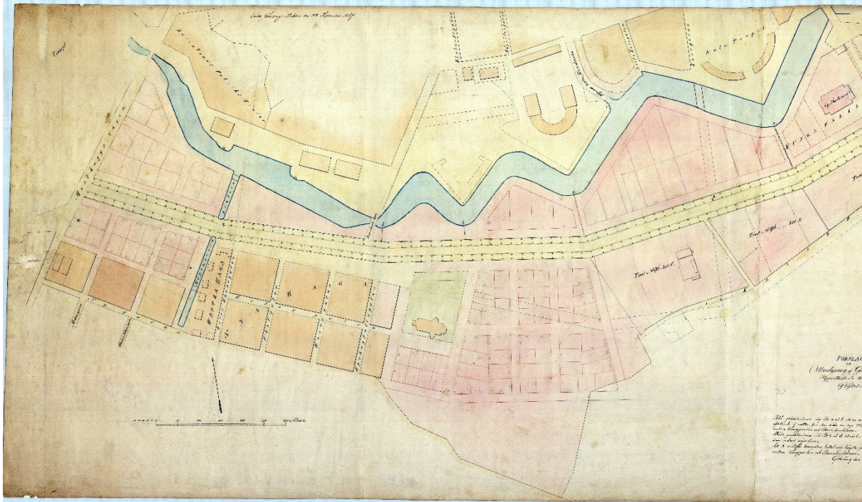
Förslag till utvidgning av Göteborg med Nya Allén år 1857. C.J. Nyström, Public domain, via Wikimedia Commons

Den första moderna kajen längs älven anlades omkring år 1860 och från järnvägsstationen drogs det fram spår till kajen, där ett nytt Tull- och Packhus uppfördes. De flesta större industrier anlades utanför staden, men Göteborgs Mekaniska Verkstad byggdes väster om Stora Bommen , Rosenlunds spinneri anlades intill Rosenlundskanalen och mellan dessa industrier låg gasverket . [35]